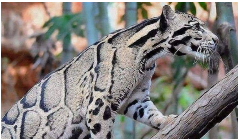
El Leopardo nublado que se creyó que estaba extinto

El motivo por el cual se creía extinto fue porque desde 1983 no se había visto uno